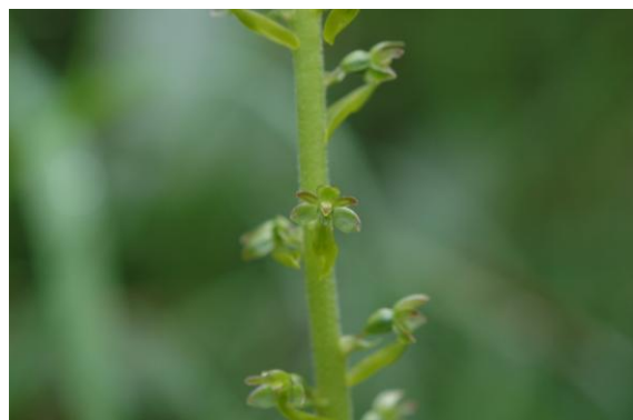
Großes Zweiblatt Listera ovata