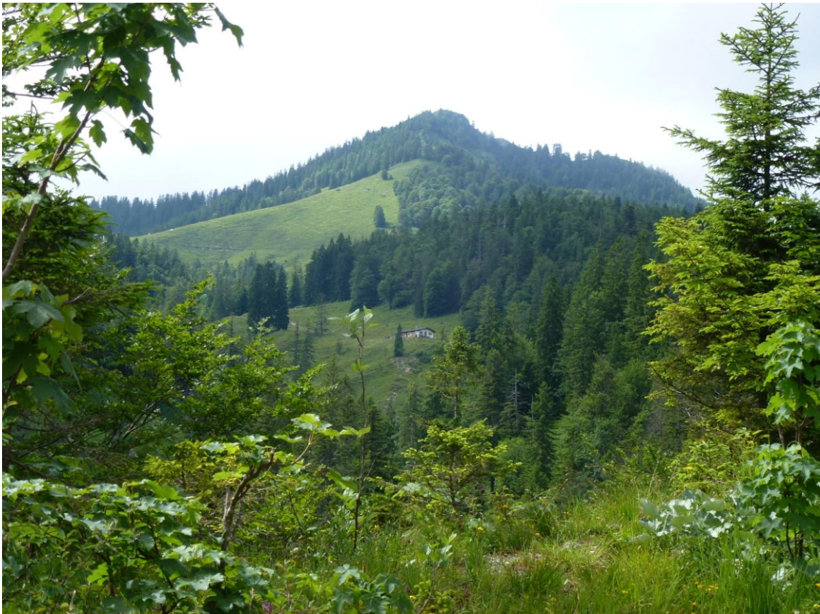
Rabenkopf 1555 m