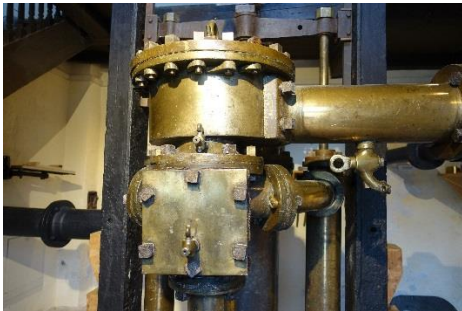
Baujahr des Kernstückes aus Messingguss 1809

wurde Holz von der Sole nicht zerfressen - von eigens entwickelten Wassersäulenmaschinen gepumpt, die der Ingenieur Georg von Reichenbach entwickelte. Um Holz zu sparen, wurde sie mit Druckwasser statt Dampf betrieben. Ein wahres Wunderwerk der Technik.