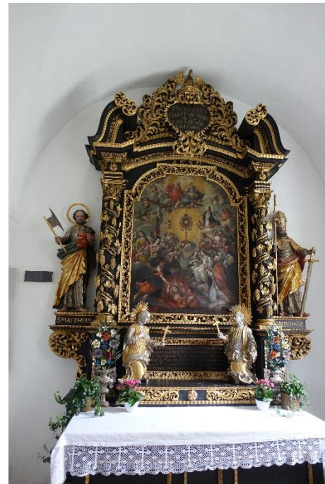
Sieben-Zufluchten-Altar aus dem Jahre 1696

Anfahrt: A 9 bis Kreuz München Nord - A 99 bis Kreuz München-Süd - A 8 bis Ausfahrt Bernau, - B 305 bis Grassau – Parkplatz Kirchstrasse Route: Parkplatz Kirche Grassau – Golfplatz – Marienkapelle – Grafing – Mietenkam- Ewigkeitsweg – Moorrundweg – Aussichtsturm – Museum Salz & Moor - Grießenbach – Wasserfall- Panoramaweg – Kucheln - Grassau Gehzeit: Gehzeiten 4 Stunden. Streckenlänge: 14,5 Kilometer Höhenmeter: 325