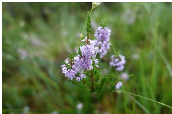
Besenheide Calluna vulgaris

Vom Parkplatz an der Kirche, rechts der Markierung Moorlehrpfad folgen. Das Asphaltsträßchen schlängelt sich durch die Häuser und übers Golfplatzgelände. Wir passierten links eine Marienkapelle, und folgten der Ausschilderung Moorerlebnisweg und Aussichtsplattform sowie Museum Salz und Moor. Nach einem Waldstück knickte der Weg im 90-Grad-Winkel nach links ab, wir überquerten auf Brettern einen Bachlauf, passierten eine kleine Picknickstelle und folgten alten Schienen der ehem. Torfbahn bis rechts der hölzerne Aussichtsturm auftauchte, der mit einer Infotafel und normalerweise mit einem fantastischen Rundumblick aufwartet. Mittlerweile ließ der Regen nach und wir trafen auf den Biologen Stefan Kattari, der uns über die Entstehung von Mooren und seiner Bewohner ausführlich berichtete. Im Gegensatz zu Niedermooren hat ein Hochmoor keine Verbindung zu den meist nährstoffreichen Grundwasserströmen und wird nur vom nährstoffarmen Regenwasser gespeist. Daher finden wir im Hochmoor niederwüchsige Pflanzen, die das nasse, nährstoffarme und saure Milieu im Hochmoor aushalten. Dazu zählen Sonnentau, Moosbeere, Scheidiges Wollgras und Rosmarinheide.