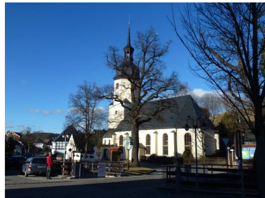
Kirche in Sosa

Am Nachmittag umrundeten wir noch die Talsperre bei Sosa.