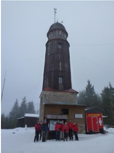
Blatensky vrch 1043m