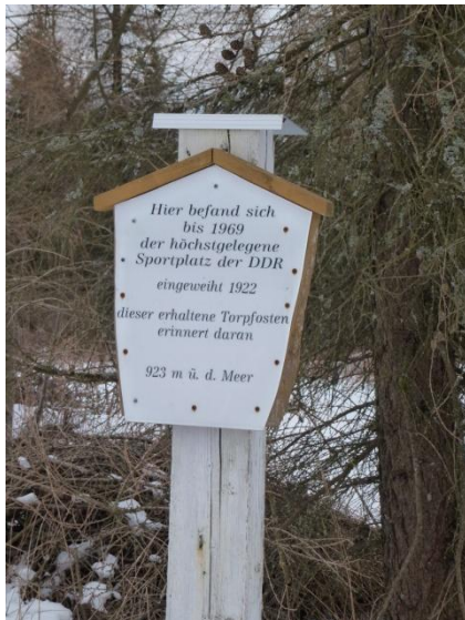
Sportplatz in 923m

Die Anreise erfolgte über die A9 und A72 Ausfahrt Treuen nach Johanngeorgenstadt. Die alte Bergwerkssiedlung Johanngeorgenstadt, die Stadt des Schwibbogens, liegt direkt an der tschechischen Grenze und zählt eigentlich zu den schneesichersten Gebieten Sachsens.