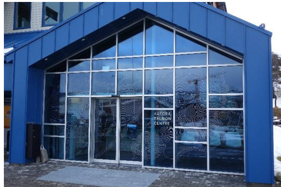
Aurora Salmon Museum

Eine Mitarbeiterin des Museums erklärte uns die Bedeutung der Lachszucht in der Region und brachte uns auch die früher sehr schwere Arbeit der Fischer näher. Der Besuch in der Fischfabrik Leroy komplettierte unser Wissen über den norwegischen Lachs. 38 Stunden nach dem Fang ist der Lachs am Bestimmungort.