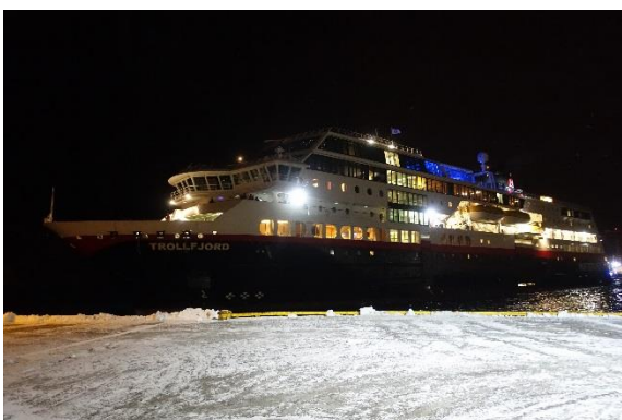
Hurtigruten MS Trollfjord

Für das Anlegen des Weges wurden die Erbauer vom König mit einer Medaille ausgezeichnet. Wir benötigten für die 344 Höhenmeter und insgesamt 4,2km Streckenlänge 2 Stunden Gehzeit. Danach waren wir durchnässt und wärmten uns im Hotel auf. Am Nachmittag kam Trond und fuhr uns noch auf das Kvänangsfjellet - einer Hochebene - mit einer phantastischen Aussicht. Leider kam der Schnee fast waagrecht daher, sodass es mit der Aussicht nicht besonders war. Am Abend fuhr er uns nach Skjervøy. Dort schifften wir uns gegen 22:30 Uhr auf der Trollfjord ein. Nach dem Bezug der Kabinen machten wir die ersten Erkundigungen auf dem Schiff. Vom Oberdeck hätten wir eine gute Aussicht auf die umliegende Landschaft gehabt, aber der Schnee kam meist waagrecht daher. Plötzlich tat sich für 10 Minuten der Himmel auf. Nordlichter - zum ersten Mal Nordlichter live.