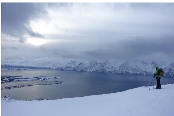
Blick in den Lyngenfjord