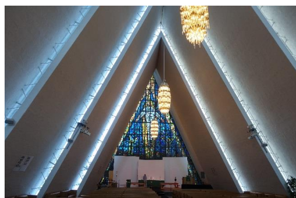
Mosaik Glasfenster –Tromsdalen Kirke

Unsere Hoffnungen wurden erfüllt. Etwa 1 ½ Stunden brannte am Himmel ein Feuerwerk ab. Die schönsten Bilder sind im Kopf gespeichert und nicht auf einem Cip. Es war einfach überwältigend.