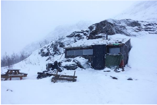
Jemelva Hütte 344m

Am nächsten Tag war wieder Regen angesagt. Er vermischte sich mit etwas Schnee. Um den Tag totzuschlagen machten wir uns auf den Weg, erreichten neben dem Einkaufszentrum eine Seitenstrasse und stapften der Loipe entlang. Bald zweigte ein geräumter Wanderweg immer stetig bergan ab. Auf diesem Weg waren wir nicht allein und ein paar Jogger – auch bergauf – begegneten uns. Nach einer Stunde erreichten wir eine Hütte, die mit allen überlebensnotwendigen Utensilien ausgestattet war.