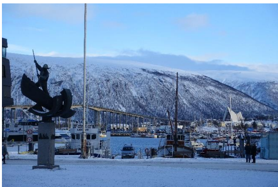
Walfänger-Denkmal, Tromsø-Brücke, Eismeerkerathedrale

Nach der Einquartierung im Hotel Thon machten wir uns sofort auf dem Weg, die Stadt zu erkunden. Die Erkundung erfolgte im Zeitraffer, den wir hatten nur ein paar Stunden an diesem Nachmittag. Domkirche, Walfänger-Denkmal, Polarmuseum, Tromsø-Brücke – die 1 km lange Brücke erwanderten wir zu Fuß -, Eismeerkerathedrale, Polaria, Hansen-Denkmal und das Nordsternmuseum standen auf dem Programm. Am Abend fuhren wir mit der Seilbahn Fjellheisen hinauf auf den Storsteinen 421m in der Hoffnung, Nordlichter zu sehen.