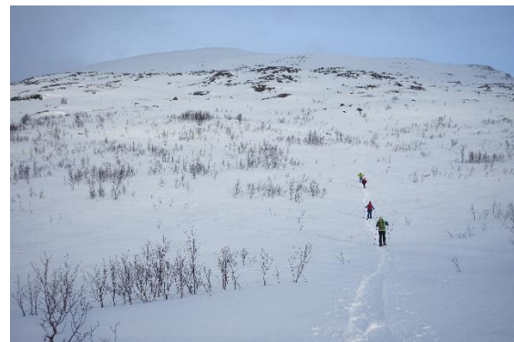
Aufstieg zum Gipfel