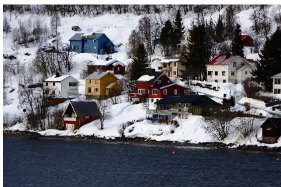
Typische Holzhäuser am Lyngenfjord

Licht wird auf unserer Reise in den Norden eine zentrale Rolle spielen. Sommernächte sind lang und hell. Und im Hochsommer verschwindet die Sonne nördlich des Polarkreises gar nicht mehr hinter dem Horizont. Winternächte dagegen sind lang und kalt. Aber lange nicht so dunkel, wie vielleicht angenommen. Denn jetzt ist die Zeit der Nordlichter gekommen, die mit Bändern und Ranken aus rotem, violetterm, blauem und grünem Licht über den Himmel huschen.