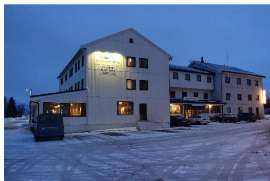
Hotel Reisafjord in Storslett

Die Anreise erfolgte von München mit einem Lufthansa-Direktflug nach Tromsø. Tromsø die größte Stadt Nordnorwegens liegt weit nördlich des Polarkreises und empfing uns sehr ungewöhnlich mit Regen. Am Flughafen wurden wir vom VW-Bus unseres Hotels abgeholt und los ging die etwa 3 ½ -stündige Fahrt nach Sørkjosen einen Ortsteil von Storslett. Die Straßenverhältnisse waren winterlich, sprich mit Eis