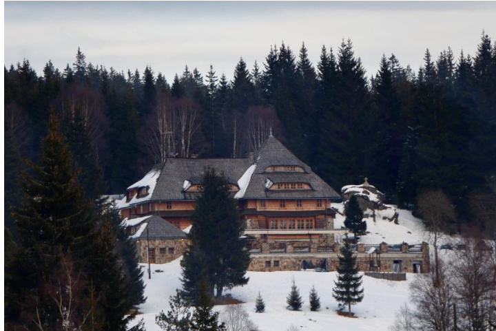
Klostermann - Chata

Tag 2 Nach einem ausgiebigen Frühstück wanderten wir von der Klostermann Chata hinunter ins Dorf, überquerten die Brücke und kurz danach begann er grün markierte Weg steil bergan. Bei leichtem Schneefall wies uns eine alte Spur den Weg. Als der Himmel aufklarte ließ er den Blick hinüber zum Lusen zu. Schon bald erreichten wir unser Ziel auf 1133m dem Ort Březník. Březník (deutsch Pürstling ) ist eine Einöde südlich von Modrava (Mader) im Luzenské údolí ( Lusental ). Das Lusental ist der kälteste und regenreichste Ort im Böhmerwald. Die Durchschnittstemperatur beträgt nur 3,7 °C und es fallen im Schnitt 1500 mm Niederschlag. An bis zu 140 Tagen im Jahr liegt Schnee und es ist in jedem Monat mit Nachfrösten zu rechnen. Entlang des Modravský potok (deutsch. Maderbach) wanderten wir wieder zurück, wobei einige von der grandiosen Landschaft überwältigt, den weiten Bogen nach Filipo Hut einschlugen und von dort nach Modrava zurückkehrten. Gehzeiten: 5 ½ Stunden, Strecke 20 Kilometer, Höhenmeter 650