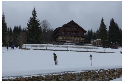
Hotel Alpská vyhlídka in Buchwald

Tag 4 Die eigentlich kurze Autofahrt über Srní (deutsch Rehberg ) nach Prášíly (deutsch Stubenbach ) gestaltete sich etwas schwierig, denn die Straßen waren fast durchgehend schneebedeckt und ziemlich rutschig. Kurz vor Prášíly ist ein Wanderparkplatz. Von dort wanderten wir auf der Straße in den Ort hinein. Kurz vorher führte uns der rot markierte Weg hinauf zum Prášilské jezero ( Stubenbacher See ) einem Gletschersee. Von dort etwas abwärts und dann stetig bergan zum Gipfel des Poledník (deutsch Mittagsberg ) Mit 1315 m ist er der höchste Berg Südböhmens. Der Mittagsberg bietet eine fantastische Aussicht über den gesamten Bayerischen Wald, vom Arber bis zum Lusen und sogar in die Alpen ins Dachsteinmassiv. Der Abstieg erfolgte Richtung Srní durch ein ehemaliges militärisches Übungsgebiet zurück zum Parkplatz. Gehzeit: 5 ¼ Stunden, Strecke 20 Kilometer, Höhenmeter 555