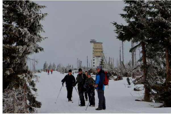
Poledník 1315 M

Tag 5 Den Abschluss der Tour bildet eine geologische Wanderung ins Tal der Vydra (deutsch Widra ). Es ist auch der tschechische Name für die Fischotter. Diese haben wir nur kurz gesehen. Der Weg von Antygl Most nach der Turnerova Chata zählt zu den schönsten Plätzen im gesamten Böhmerwald. Schon bald treffen wir auf die Geologische Erscheinung der Wollsackverwitterung. Sie ist eine besondere Erscheinungsform der Verwitterung von Gesteinen. Durch das Zusammenwirken von physikalischen und chemischen Prozessen entstehen bei der Wollsackverwitterung kantengerundete Gesteinsblöcke, die wie Kissen, Matratzen oder eben wie Wollsäcke übereinander gestapelt liegen. Der bildliche Begriff „Wollsack“ leitet sich dabei von mit Wolle gefüllten groben Säcken ab, die insbesondere historisch sowohl als Schlafunterlage als auch zum Transport von Wolle verwendet wurden. Kurz vor der Turnerova Hütte kommen wir zu einer weiteren Geologischen Seltenheit, dem Stein Meer. Es ist eine große Oberfläche mit einer chaotischen Anhäufung von boulderartigen Steinen. In der Regel ist es das Ergebnis des Zerfalls von Felspartien, durch Frostverwitterung oder Erdbeben. Der Rückweg erfolgte auf den Hinweg. Gehzeiten: 2 Stunden, Strecke: 7 Kilometer, Höhenmeter 120