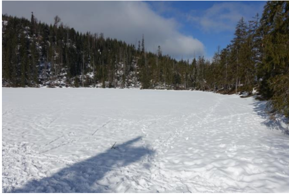
Prášílské jezero Stubenbacher See