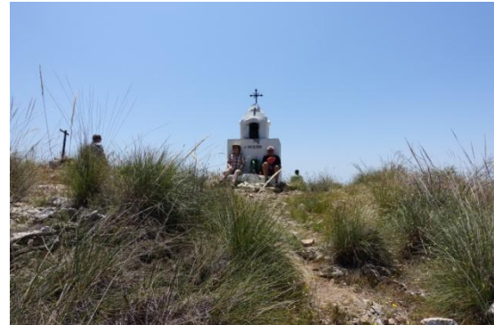
Cruz de Pinto

9. Tag Heute am Ruhetag war Sonne, Strand und Meer angesagt.