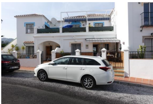
Wohnung in Nerja

Tag 1 Direktflug von München nach Malaga mit Air Berlin. Weiterfahrt mit Mietautos nach Nerja. Einquartierung in den Ferienhäusern. Gemeinsames Mittagessen – Paella- und danach Einkauf in den Supermärkten. Besuch des Balcon de Europa und Abendspaziergang am Strand.