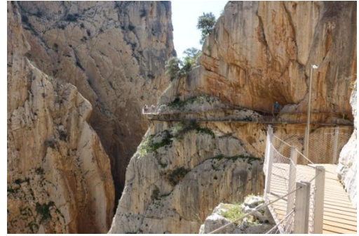
Caminito del Rey