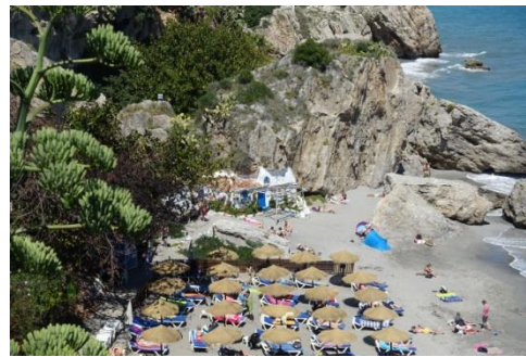
Blick vom Balcon de Europa

8.Tag Heimreise für 8 Teilnehmer. Die Restlichen 10 Teilnehmer fahren mit dem Auto in das weiße Dorf Frigiliana. Das historische Viertel von Frigiliana ist von seinem Ursprung her im maurischen Mudéjar-Stil erbaut, und es ist zweifellos eines der am besten erhaltenen in der ganzen Provinz Malaga. Egal, wann man es besucht, wird es uns in vergangene Zeiten entführen, wo es weder Lärm noch Fahrzeuge gibt, keine Hetze und definitiv all das nicht, was wir normalerweise in unserem täglichen Leben mitbekommen.