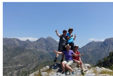
El Fuerte 963m

14. und 15. Tag Ruhetag am Meer und Heimreise