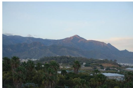
Alto del Cielo 1508m