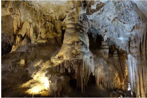
Höhlen von Nerja