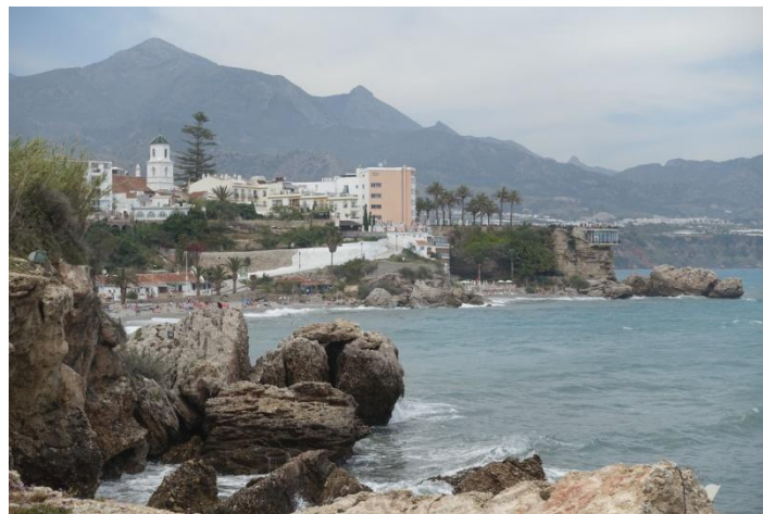
Nerja mit dem Balcon de Europa

12. Tag Der steil aus dem Meer aufragende Felsklotz war im Altertum bekannt als eine der beiden „mythischen Säulen des Herkules“. Als sein Gegenstück galt der Djebel Musa in Marokko. Jenseits dieser Landmarken vermutete man damals das Ende der Welt.